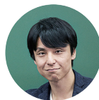
英語教育界の革命児 関 正生